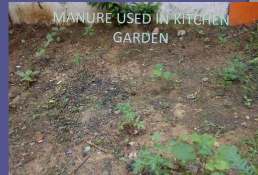
MANURE USED IN KITCHEN GARDEN

We maintain garbage – manure pits in the school. Waste food material and the litter including other biodegradable waste are put in these pits and is later used as natural manure for our kitchen gardens and trees. Sometimes these pits play the role of nurseries with seedlings and baby plants.